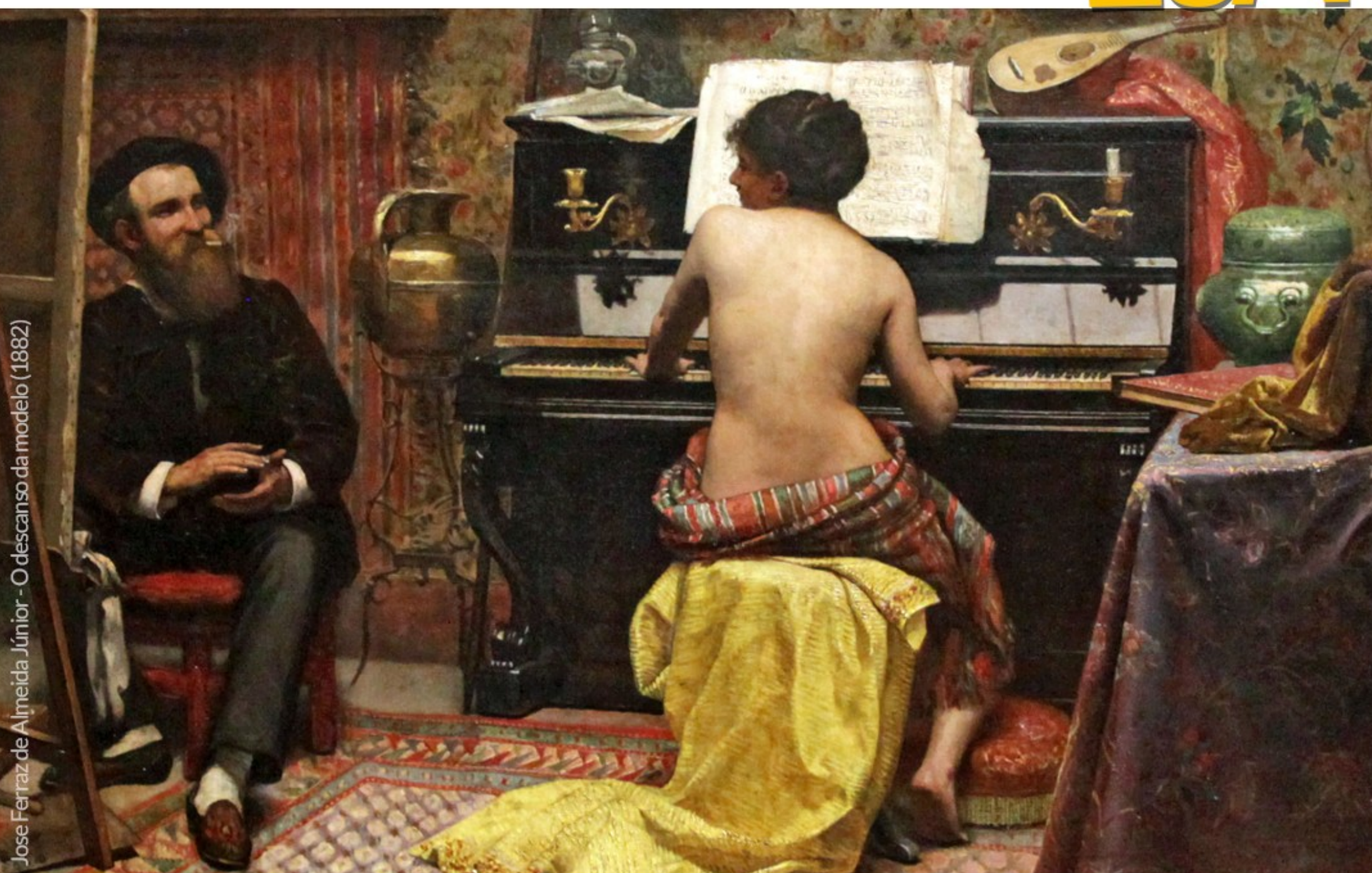
Jose Ferraz de Almeida Júnior - O descanso da modelo (1882)

A participação na MuseumWeek é gratuita. Não há necessidade de inscrição, basta postar e usar a hashtag do dia junto com #MuseumWeek ou #MuseumWeek2020.